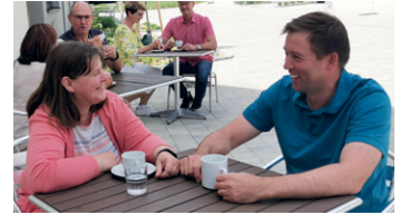
Zeit zu zweit