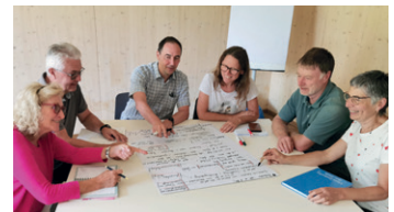
Zeit zum Austausch