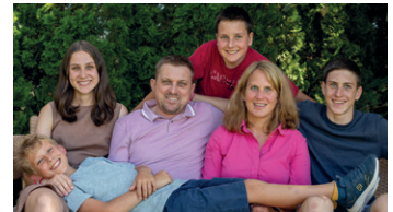
Zeit als Familie