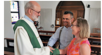
Wachsen als Ehepaar