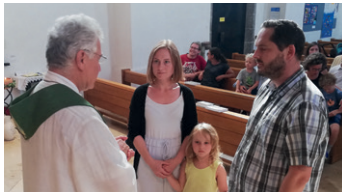
Wachsen als Ehepaar