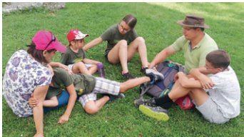
Zeit als Familie