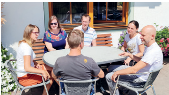
Zeit zum Austausch